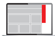
Skyscraper 120 x 600 px