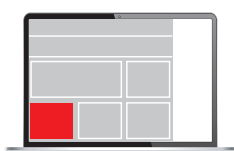
Medium Rectangle 300 x 250 px