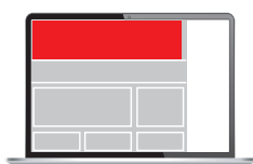
Billboard 960 x 250 px