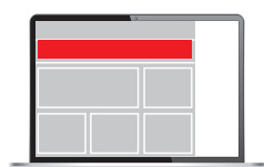
Superbanner 728 x 90 px

Satzspiegel (SSP): Anlieferung ohne Schnittangaben und Passermarken. // Abfallend (abf.): +3 mm Beschnittzugabe an allen Seiten. Bitte platzieren Sie anschnittgefährdete Logos oder Texte bei abfallenden Anzeigen 5 mm vom Beschnitt weg. // Versand der Druckdaten: nur als PDF-Dateien.