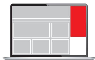
Halfpage Ad/Sidebar 300 x 600 px