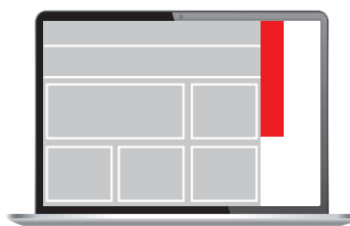
Skyscraper 120 x 600 px