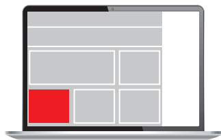
Medium Rectangle 300 x 200 px