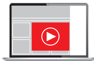
Video/Instream 4:3 / 16:9