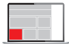
Medium Rectangle 300 x 200 px