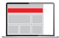
Superbanner 728 x 90 px

Satzspiegel (SSP): Anlieferung ohne Schnittangaben und Passermarken. // Abfallend (abf.): +3 mm Beschnittzugabe an allen Seiten. Bitte platzieren Sie anschnittgefährdete Logos oder Texte bei abfallenden Anzeigen 5 mm vom Beschnitt weg. // Versand der Druckdaten: nur als PDF-Dateien.